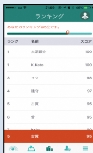
スコアランキング