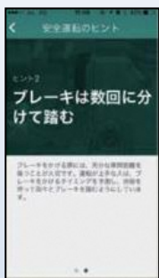
安全運転のヒント